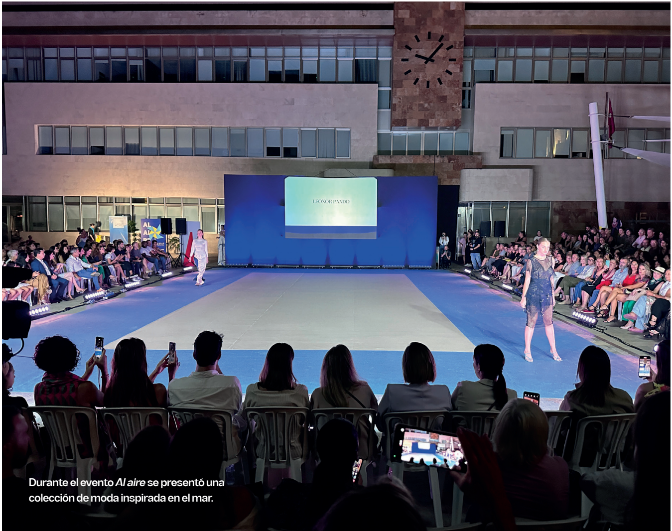
Durante el evento Al aire se presentó una colección de moda inspirada en el mar.