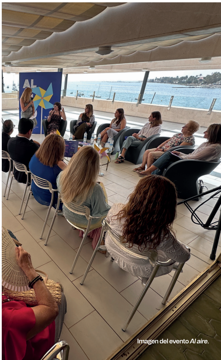
Imagen del evento Al aire .

El nuevo evento cultural Al aire interconecta disciplinas artísticas a través del hilo conductor de los vientos milenarios y se consolida como nuevo espacio para el encuentro y la reflexión entre los artistas y el público