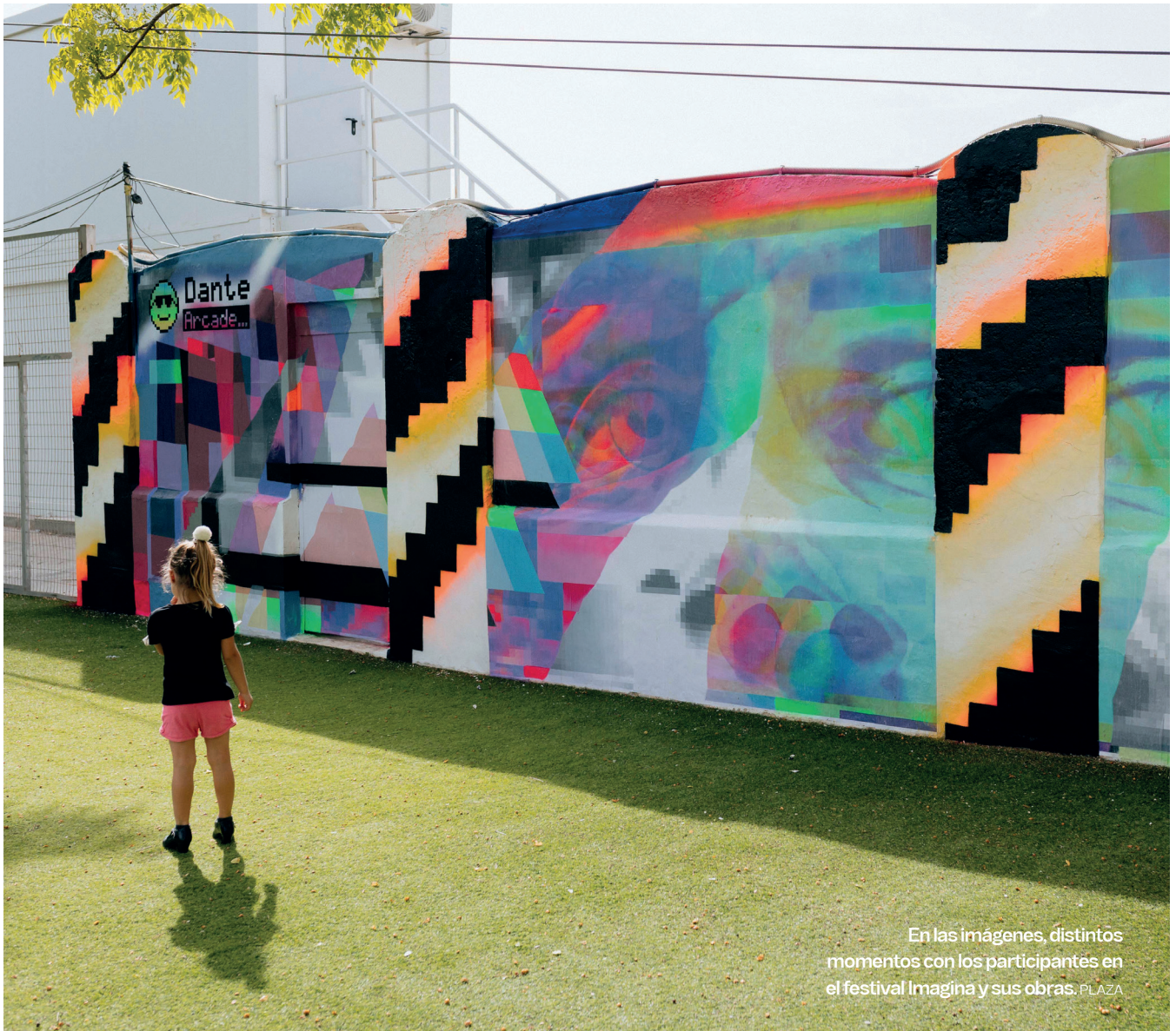
En las imágenes, distintos momentos con los participantes en el festival Imagina y sus obras. PLAZA