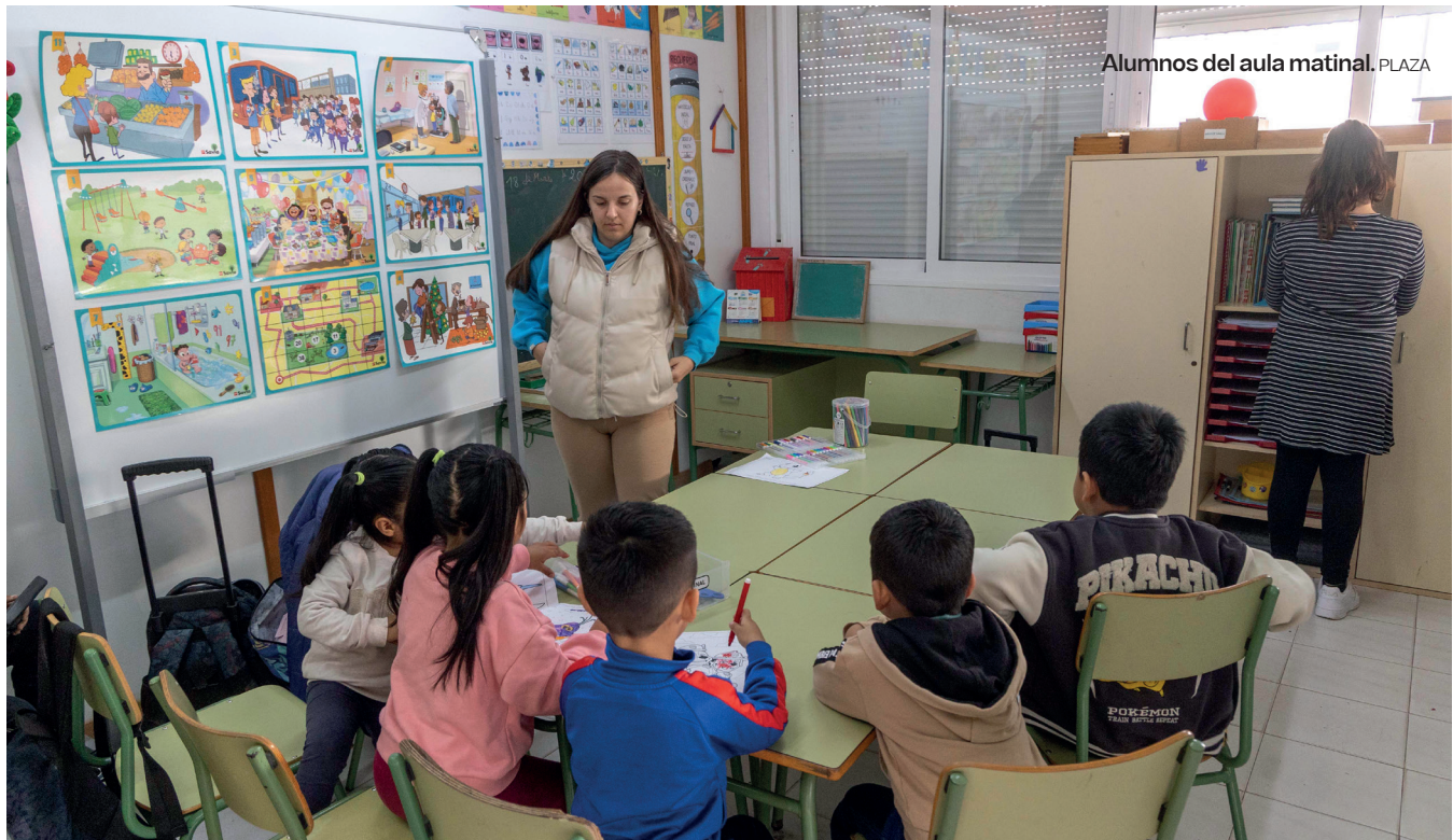
Alumnos del aula matinal. PLAZA