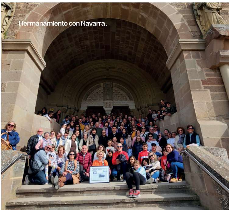
Hermanamiento con Navarra.