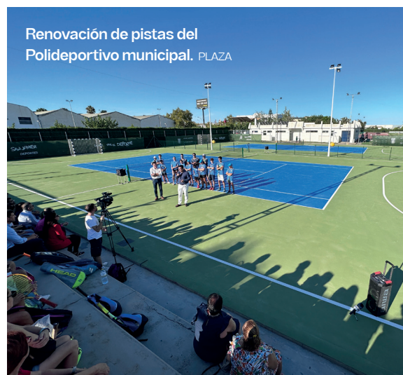
Renovación de pistas del Polideportivo municipal. PLAZA