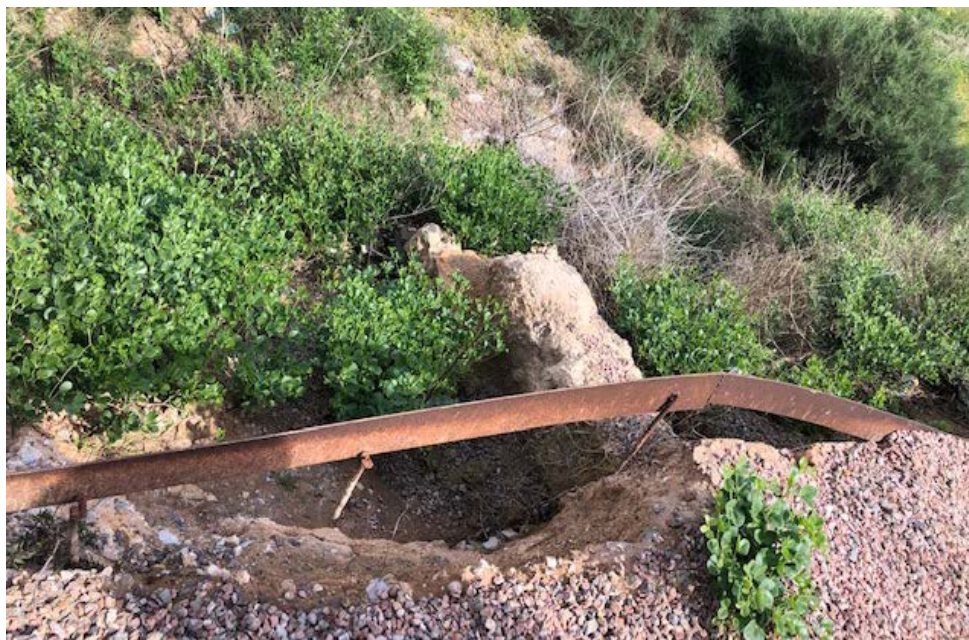
Fig. 4: estado actual en el que se encuentra una de las cisternas de la muralla púnico-republicana.

Por todo lo señalado anteriormente, RESUELVO: