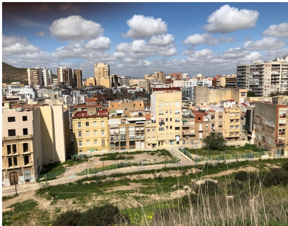
Fig. 2: vista de las parcelas de Morería Baja, desde la cima del Cerro del Molinete

El Parque del Molinete tiene una superficie aproximada de 26.348 m 2 , catalogado como manzana de espacio libre (R0-PEOPCH-0248) dentro del Plan Especial de Ordenación y Protección del Centro Histórico. En la actualidad, y según la documentación disponible, carece de un Plan Especial propio, siendo identificado como la Unidad de Actuación Área CA2 (Molinete), U.O.1, que correspondería a la antigua U.A. única del PERI El Molinete (fig. 3).